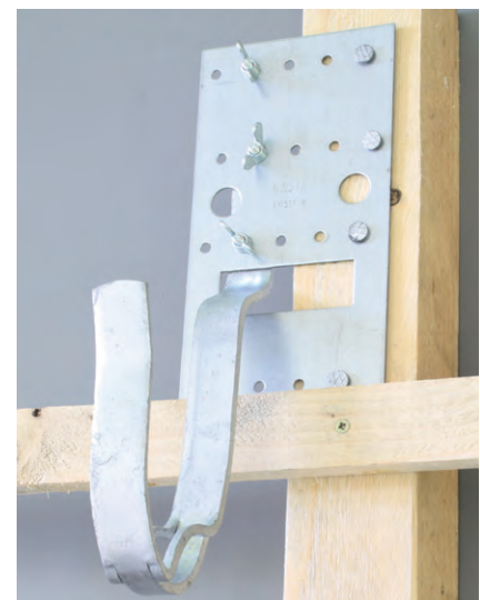
Ortgang rechts Montage links vom Sparren