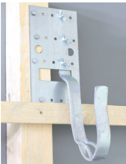
Ortgang links Montage rechts vom Sparren

Bei Biberdeckung für die Aufnagelung der Dachlatte im Bereich der Sicherheitsplatte die 20 mm Lochdurchführung benutzen!