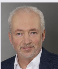
Autor Dipl.-Kfm. Dirk Lefringhausen ist geschäftsführender Gesellschafter der Gust. Overhoff GmbH & Co. KG.

Nach Ermittlung von Beanspruchungsreihen durch Prüflasten und Rinnenhalterabstände können die Nennmaße aus der Tabelle in der Fachregel herausgelesen werden. //